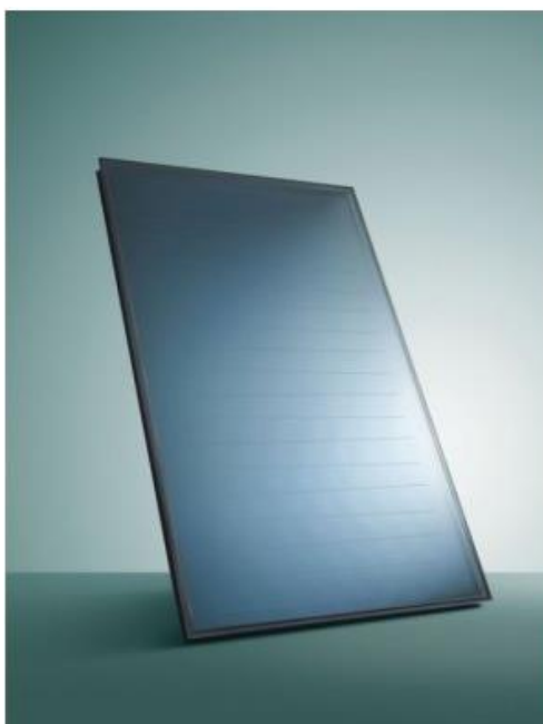
Slika 4.10 Prikaz odabranog solarnog kolektora

Razlika između prve i druge izvedbe je u generatoru topline te spremniku i broju solarnih kolektora.