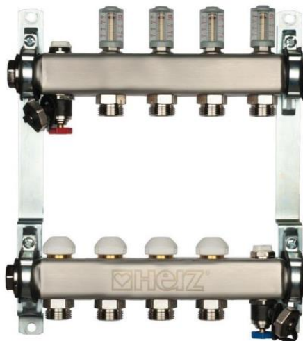
Slika 4.3 Prikaz odabranog razdjelnika

Odabrana su i dva razdjelnika za podno grijanje. Za prizemlje je potreban razdjelnik s 12 krugova grijanja. Odabran je model HERZ Inox TO 312 (slika 4.3). Njegove tehničke značajke prikazane su na slici 4.5.