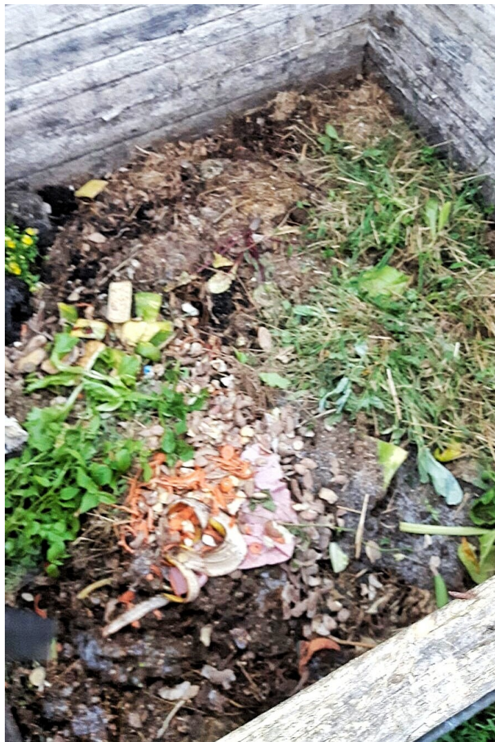
Slika 5.2. Kompostni materijal u drugom tjednu mjeseca svibnja

U prvom tjednu, bačene su slama, stare maćuhice sa dodatkom zemlje, ostaci jabuka, klice od starog krumpira, grančice voćki, trava i ostale zelene biljke. Kako je bilo dosta suho i toplo razdoblje, povremeno je dodano malo vode kako kompostna hrpa ne bi izgubila vlagu.