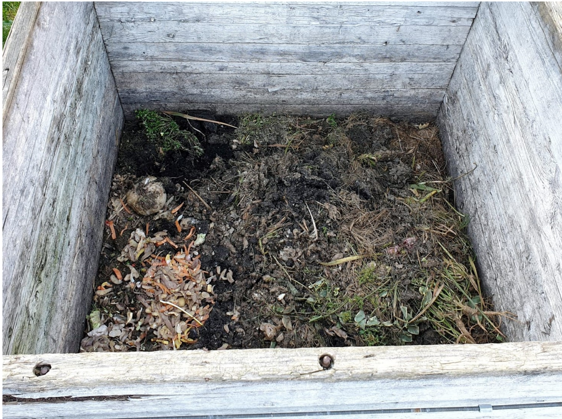
Slika 5.4. Kompostni materijal u četvrtom tjednu mjeseca svibnja

U zadnjem tjednu promatranja, do izražaja najviše dolazi zemljana boja komposta. U hrpu su se i dalje odlagali kompostni materijali kao što su lupine krumpira, mrkve, krastavaca, kore jabuke i banane, suha trava itd. Neugodnih mirisa nije bilo jer se hrpa dosta često okretala i prozračivala, naročito u zadnjem tjednu zbog pojačanih oborina.