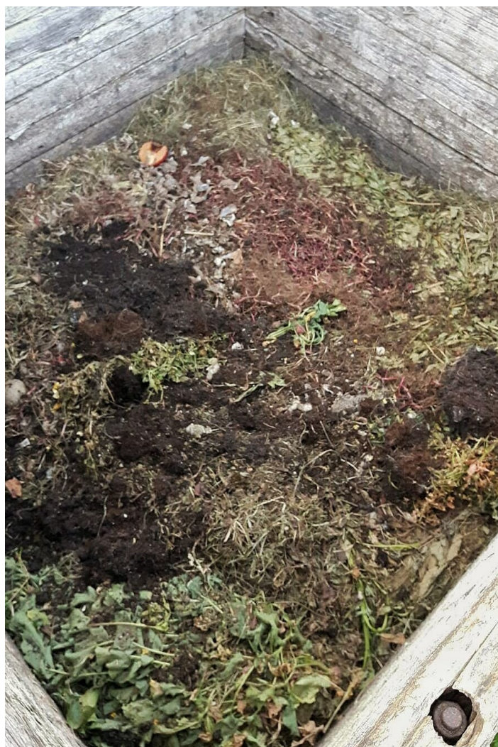
Slika 5.1. Kompostni materijal u prvom tjednu mjeseca svibnja

Kao što je ranije navedeno, na proces kompostiranja, utječu brojni parametri: od vremena, smještaja kompostera, vlage, temperature, vrste otpada koje se kompostira do padalina itd. Unutar 30 dana kompostiranja, u nastavku će se vidjeti promjene koje su se desile. Naravno, proces kompostiranja bio bi idealan kada bi trajao minimalno šest mjeseci. Moram naglasiti kako se u kompost skoro pa svakodnevno baca otpadni materijal, jer kako u našem domaćinstvu boravi pet osoba, prikupi se i dosta otpada. Vremensko razdoblje za praćenje procesa kompostiranja se odvijalo u mjesecu svibnju, u Ogulinu. Mjesec svibanj je bio pretežito sunčan i topao, osim u zadnjem tjednu kada je prevladavao kišni period gdje je došlo i do pada temperature. Prosječna temperatura za cijeli mjesec bila je oko 22,5°C. Komposter je napravljen od drvenih dasaka dimenzija 1,5 x 1,5 x 1,5 m i upotrebi je sigurno oko petnaest godina. Prije samog započetog promatranja procesa kompostiranja, komposter je ispražnjen radi gnojidbe vrta prije početka proljetne sadnje.