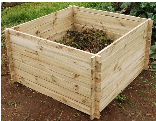
Slika 3.1. Vrtni komposter

Odlaganje materijala za kompostiranje može se postići zbrinjavanjem otpada u plitke jame, umjesto na površinu tla. U tom slučaju se zidovi i dno jame oblažu ciglom ili se nabije prirodna zemlja. Materijal se slaže na visinu od 30 cm ili više iznad tla, čineći ukupnu dubinu od 0,9-1,4 m. Materijal se može okretati u jami onoliko često koliko je potrebno kako bi se osigurale potrebne visoke temperature i aerobni uvjeti. Kada se koriste jame, manja površina hrpe je izložena zraku, a zidovi i dno jame osiguravaju određenu izolaciju od gubitka topline i vlage. Ako jame nisu obložene, zidovi se mogu rušiti i oblik jame postaje nepravilan. Predlaže se kompostiranje u jamama od približno 0,9 m s dubinski sustavom osiguravanja aerobnih uvjeta i visokih temperatura prvih nekoliko dana. U početnom sloju ima dovoljno kisika da aerobni organizmi proizvedu visoku temperaturu tijekom prvih nekoliko dana. Kako se hrpa slegne, ponekad se postavlja još jedan sloj otpada za održavanje željene dubine. Zasiurno je manje jamstva, kod jama kao kompostera, da su razvijene dovoljno ujednačene i visoke temperature za uništavanje patogena. Osim toga, problem suzbijanja muha i mirisa truljenja ozbiljan je kada prevladavaju anaerobni uvjeti.