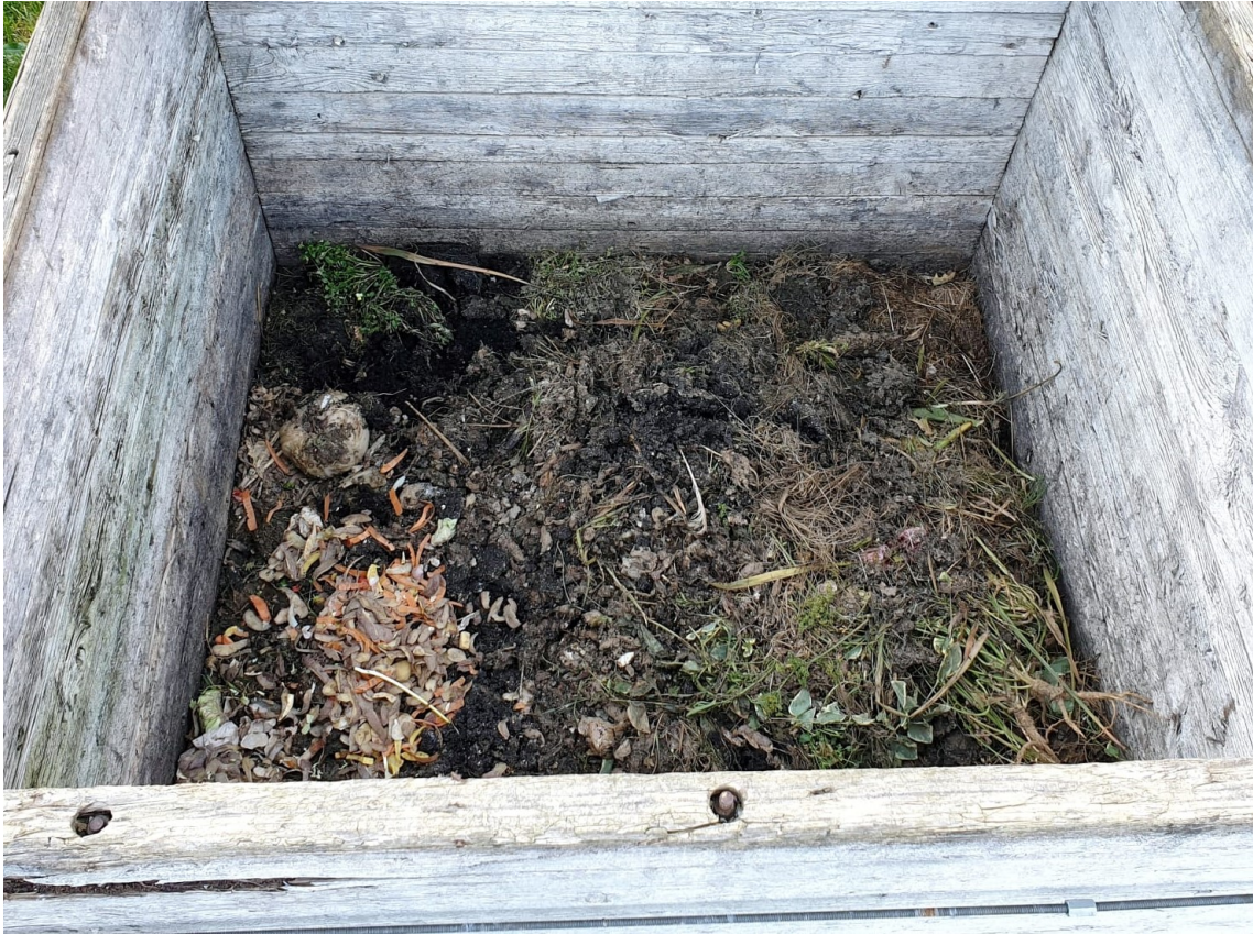
Slika 5.4. Kompostni materijal u četvrtom tjednu mjeseca svibnja

U zadnjem tjednu promatranja, do izražaja najviše dolazi zemljana boja komposta. U hrpu su se i dalje odlagali kompostni materijali kao što su lupine krumpira, mrkve, krastavaca, kore jabuke i banane, suha trava itd. Neugodnih mirisa nije bilo jer se hrpa dosta često okretala i prozračivala, naročito u zadnjem tjednu zbog pojačanih oborina.