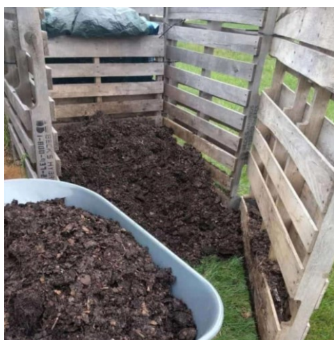
Slika 4.3. Gotovi kompost