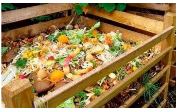
Slika 4.1. Sirovi kompost

Zaključno, u procesu kompostiranja ima podosta čimbenika i popratnih efekata koji ubrzavaju ili usporavaju sam proces, ali može se reći da je vrijeme ključni čimbenik koje definira zrelost komposta.