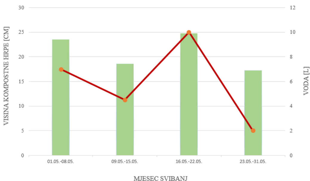
Slika 5.5. Grafički prikaz ovisnosti vremena o visini kompostne hrpe i dodavanjem vode

Na temelju vođenja podataka o visini kompostne hrpe i dodatku vode u mjesecu svibnju, iz grafičkog prikaza vidljivo je sljedeće: početak mjeseca bio je dosta topao i bez oborina pa je time i dodana veća količina vode. Kompostna hrpa otprilike je bila visoka oko 23,5 cm. Tokom idućeg tjedna, visina hrpa se smanjila za nešto manje od 5 cm, vlažnost je bila bolja u odnosu na 1. tjedan pa je bilo potrebno dodavati i manje količine vode. Otprilike je dodano oko 5l vode. U trećem tjednu, visina kompostne hrpe se je dosta povećala iz razloga jer se skupilo i više kompostnog otpada. Oborina nije bilo, samim time bila je veća potreba za vlažnošću dodatkom vode. Na samom kraju tj. zadnjem tjednu mjeseca svibnja, kompostna hrpa se smanjila. Na sreću, bilo je i nešto kiše pa brige za vlažnošću kompostne hrpe nije bilo u tolikoj mjeri. Kompostna hrpa se prozračivala ručnim okretanjem 1-2 puta tjedno.