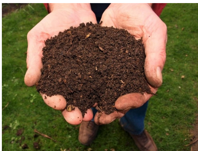
Slika 4.4. Fini kompost