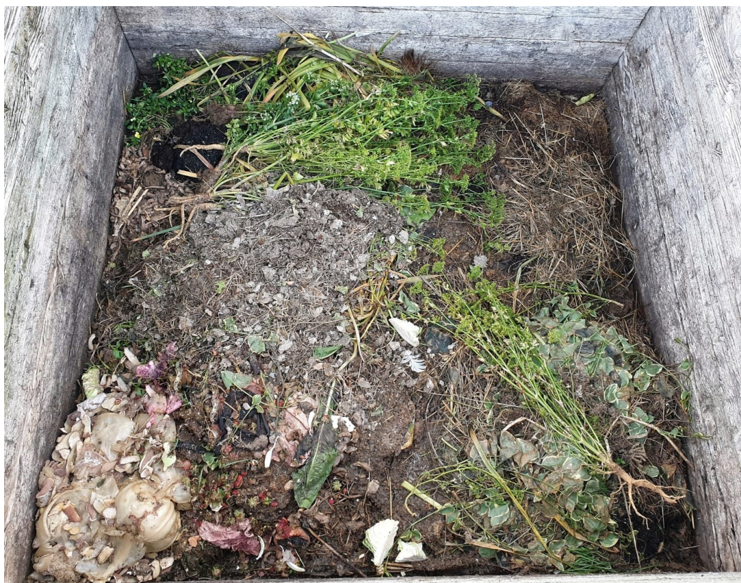
Slika 5.3. Kompostni materijal u trećem tjednu mjeseca svibnja

Krajem trećeg tjedna, kompostna hrpa se ponovno smanjila i slegla. Kako se hrpa sve više smanjivala i postajala zbijenija, tako se je i vlažnost povećavala bez obzira na suho i toplo vrijeme bez padalina, pa je bilo potrebno češće prozračivanje i okretanje kompostnog otpada kako bi se osiguralo što više kisika, a osim toga spriječio razvoj neugodnih mirisa. Ponovno su odloženi ostaci suhe trave, slame, kupusa, lupine krumpira i slično. Neki materijali su usitnjeni, dok su neki ostali u većim komadima.