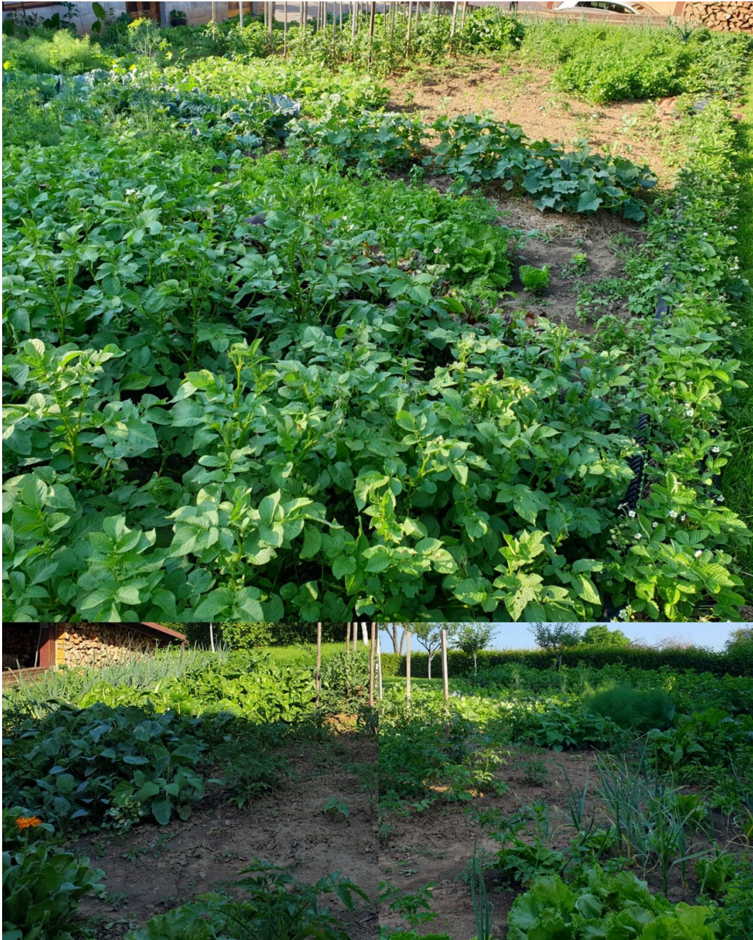
Slika 5.6. Povrtni vrt

Gore je navedeno, da je prijašnji kompostni materijal ispražnjen, tj. iskorišten je u gnojidbi vrta za proljetnu sadnju povrća. On je prosijan kroz sito i raspoređen po cijeloj zemljanoj površini. Nakon toga je "pofrezan" sa zemljom te slijedom toga vrt je bio spreman za sadnju. Nakon gnojidbe i sadnje povrća prošlo je više od mjesec dana, a krajnji rezultat može se vidjeti na priloženoj fotografiji koja vrvi od zelenila, što znači da je kompost urodio plodom.