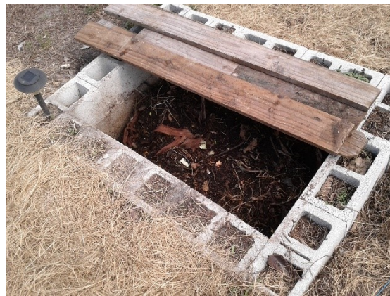
Slika 3.2. Jama kao komposter