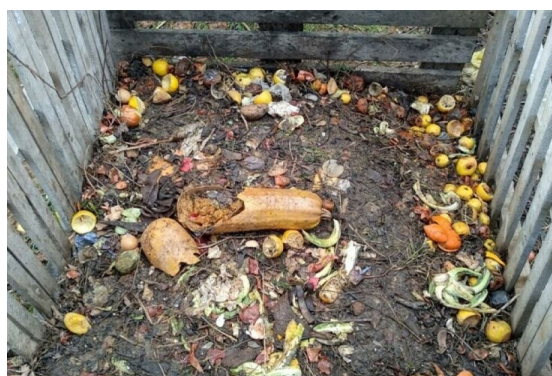
Slika 4.2. Polugotovi kompost