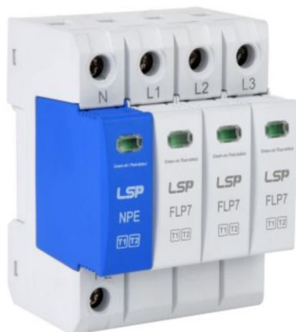
Slika 3. Prikaz odvodnika prenapona

Odvodnici prenapona su uređaji koji štite energetske transformatore i ostalu skupocjenu opremu u postrojenju od prenapona. Spojeni su u paralelu s opremom koju štite kako bi preusmjerili struju koja se javlja prilikom prenapona. Najčešće se priključuju između faznih vodiča i zemlje, obično na ulazu u rasklopno postrojenje, a posebno ispred transformatora. Ponašaju se kao nelinearni otpori, čiji se iznos mijenja u zavisnosti od veličine napona. Odvodnici prenapona, osim amplitude nailazećeg naponskog vala, smanjuje i njegovu strminu [12].