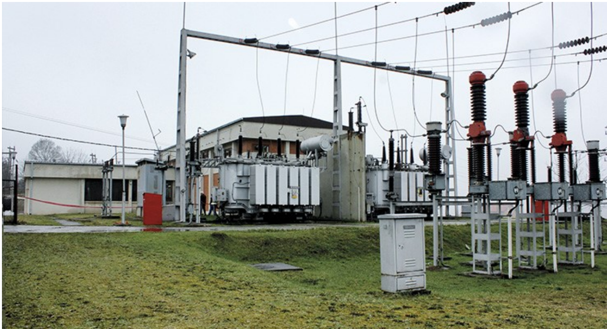
Slika 1. Transformatorska stanica

Prekidači u strujnim krugovima prekidaju električnu energiju poput sklopki koje uključuju i gase svjetla u kućanstvima. Prekidači prekidaju električnu energiju kada se pojave neočekivani udari ili kvarovi, kako bi zaštili sustav od oštećenja - poput prekidača na glavnoj servisnoj ploči u kućanstvima [4].